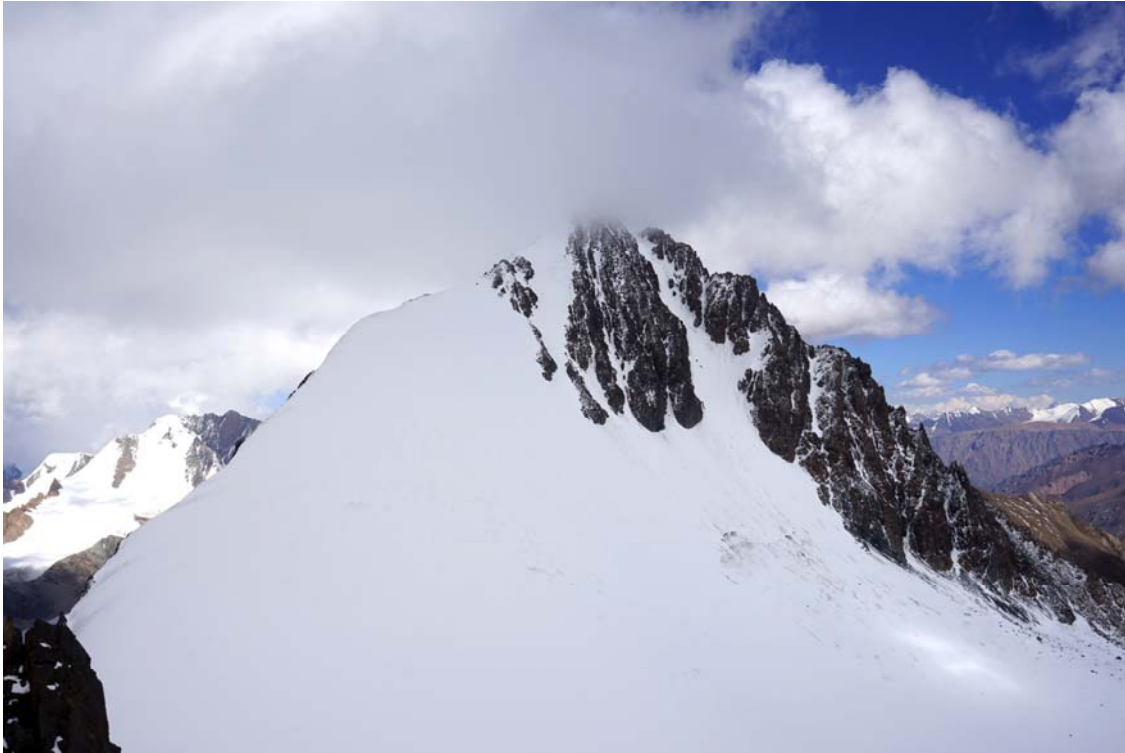
A.R. Vanago viršūnė 4598m.