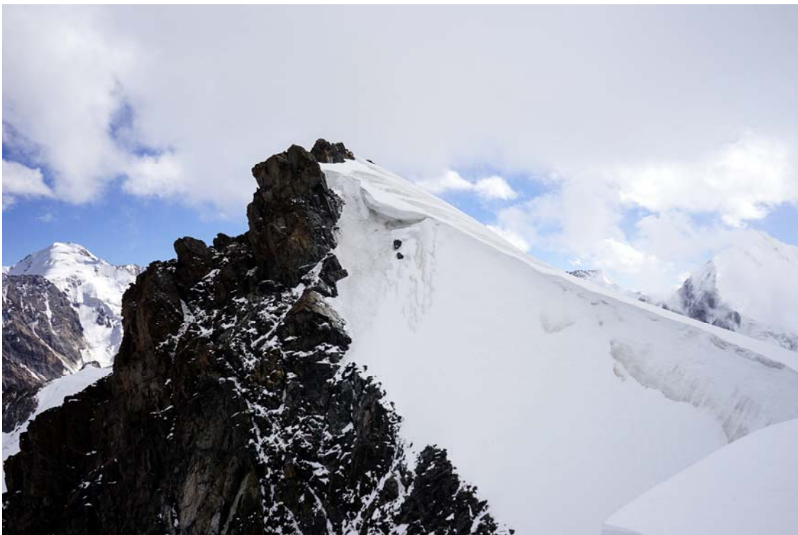
Panevėžio viršūnė 4516m.