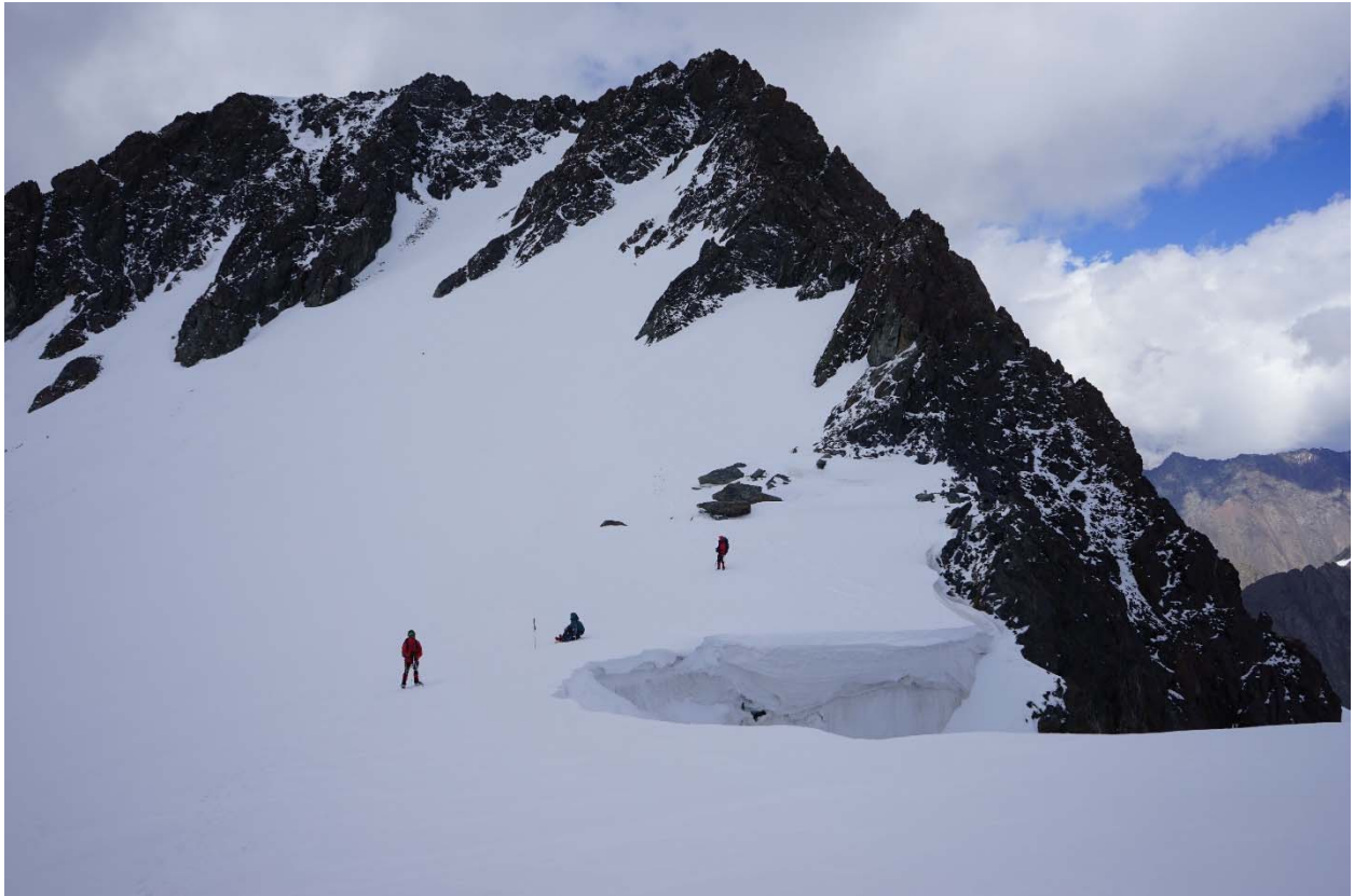
A.R.Vanago v. (vaizdas nuo Panevėžio v.)