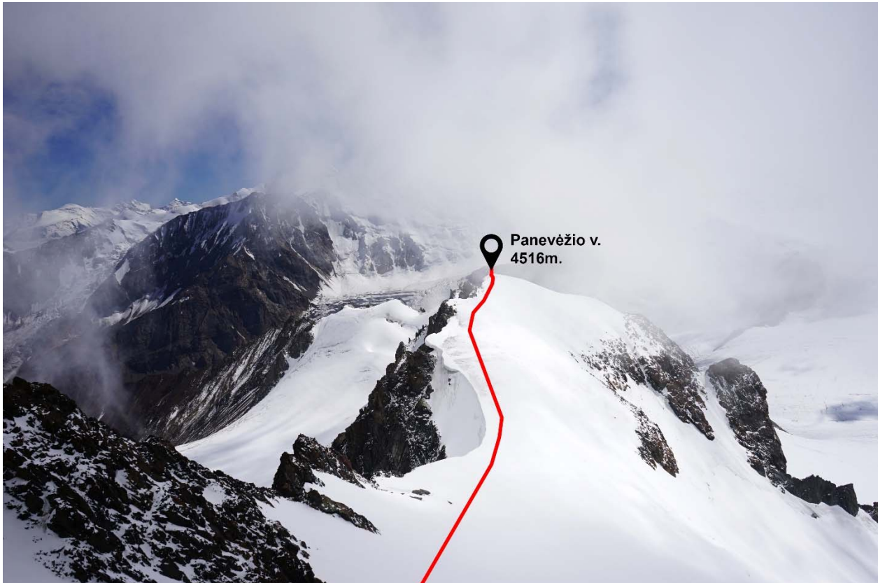
Kopimo į Panevėžio v. maršrutas