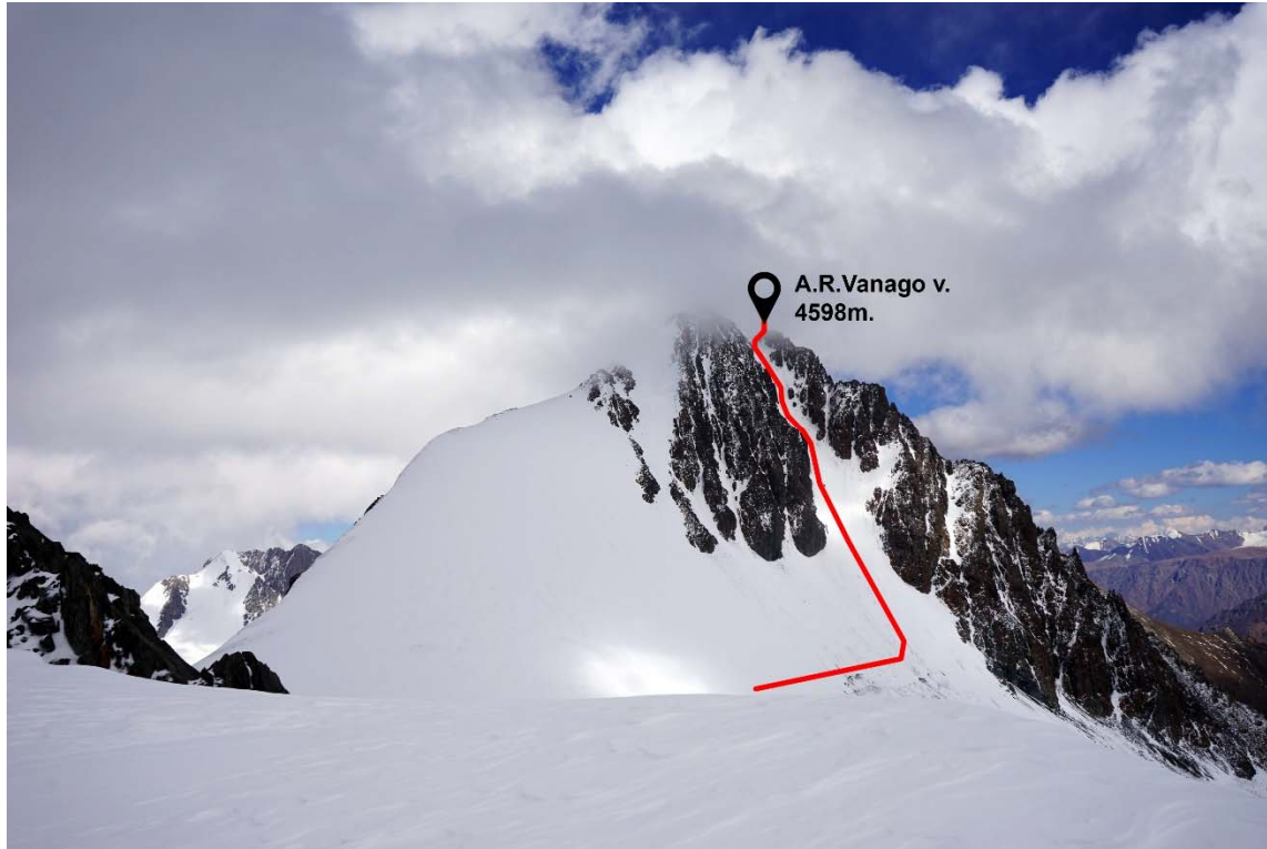
A.R. Vanago kopimo schema (vaizdas nuo Nemuno v.)