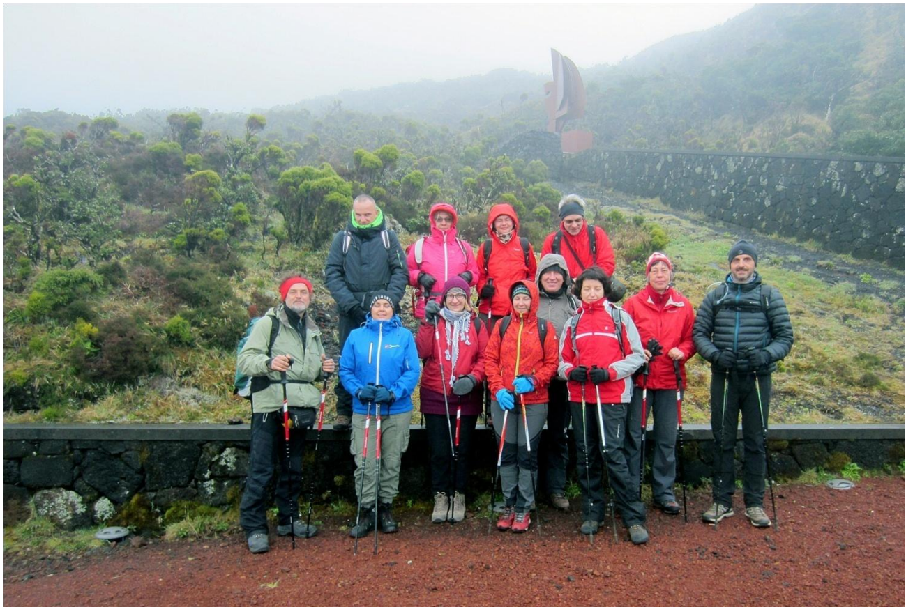
Maršruto pradžia Cabeço das Cabras 1231 m (Visitor's center) 38°28'14.3"N 28°25'35.3"W Ten yra ir nedidelė vulkanologijos ekspozicija. Toliau takas per lavą iškart aukštyn. Maršruto pradžia žymi metalinis "paukštis".