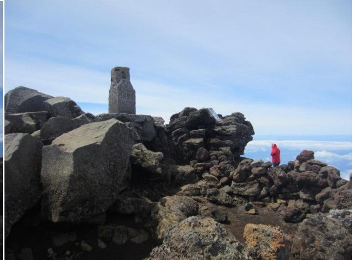
Viršūnę žymi betoninis stulpas. (foto 9 -11)