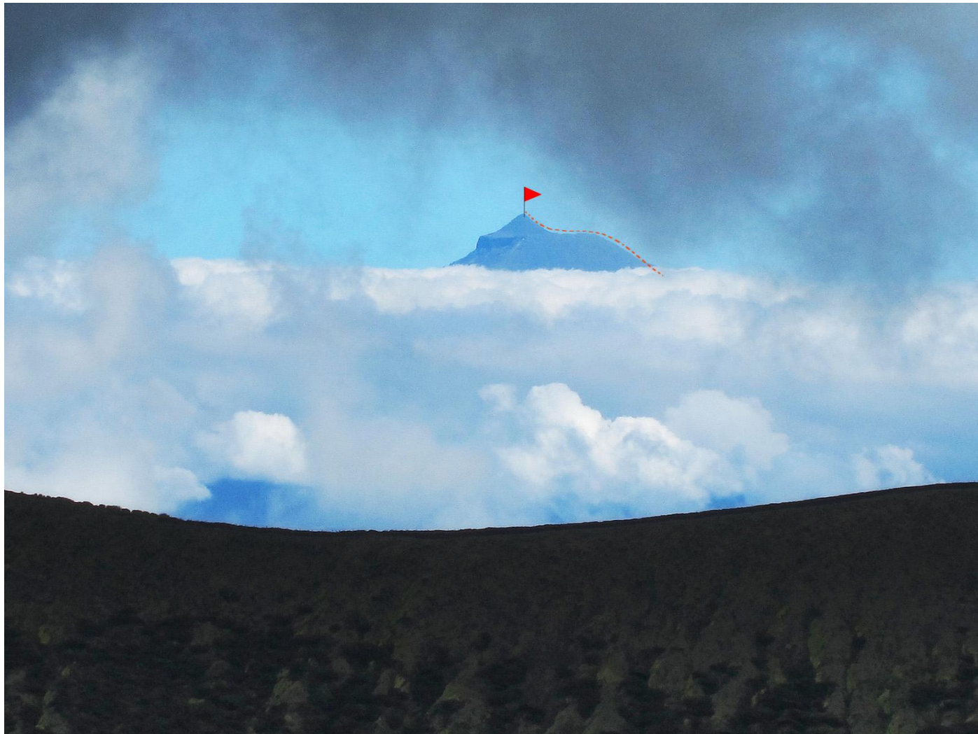
Maršrutas raudonai . (foto 3 iš Faial salos ). Foto 4 iš lėktuvo skrendant iš Flores į San Miguel .