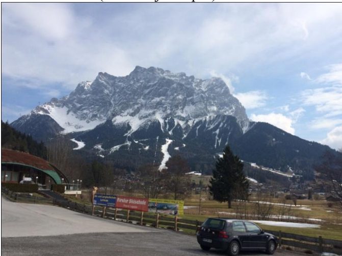
Zugspitze 2962 m ( Vokietijos Alpės)