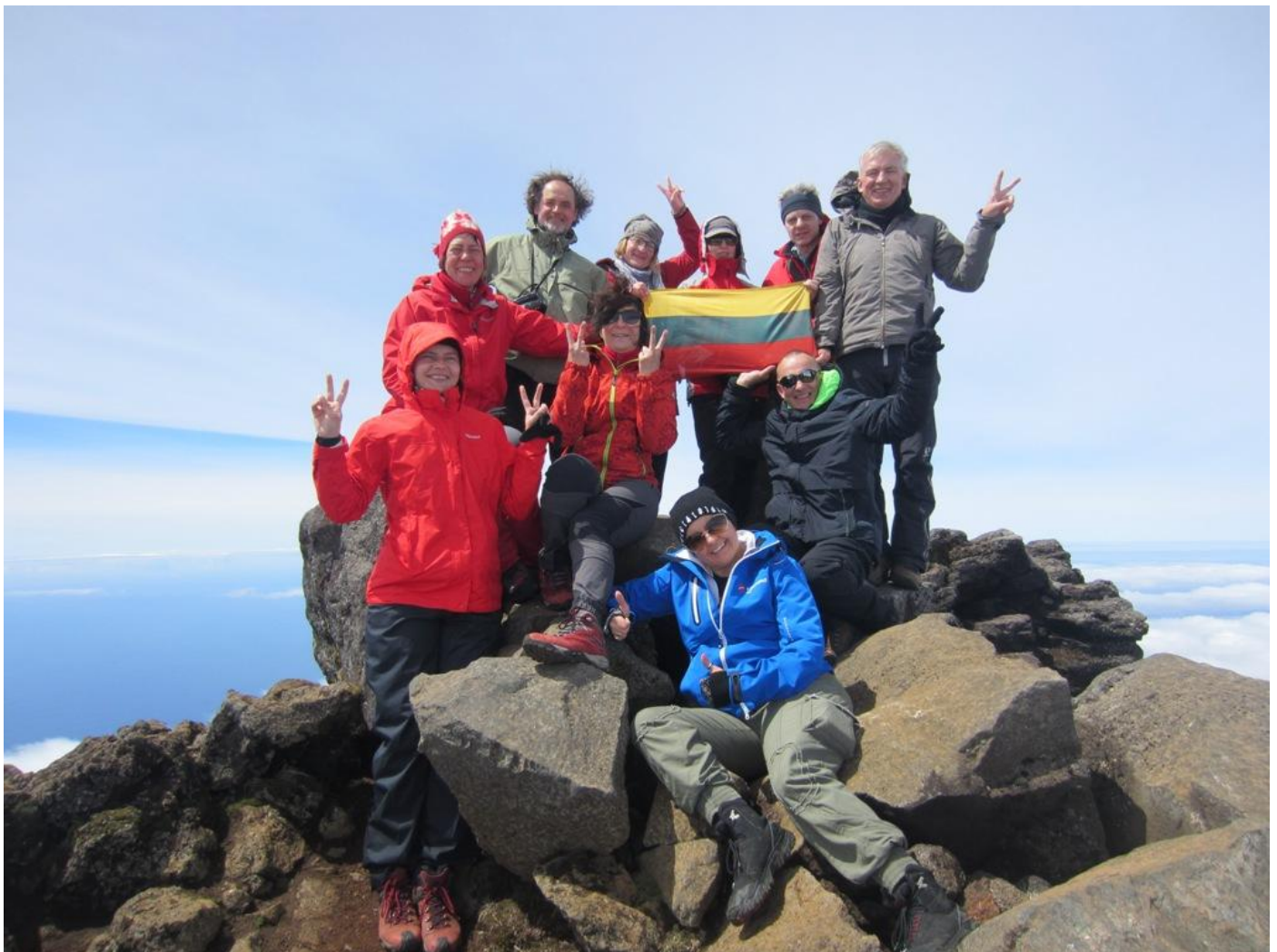
Lietuvos trispalvė Piku (Pico) 2351 m viršūnėje. 2016 m. balandžio 26 dieną, 11:00. (foto 9 -11)