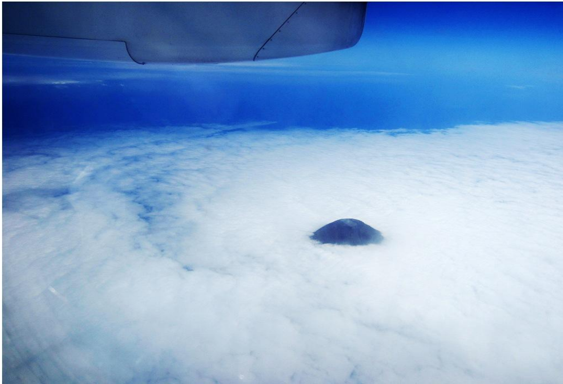
Gineso rekordininkas, Azorų salyno ir Portugalijos „stogas“ – Pico ugnikalnis 2351 m. (foto 1)