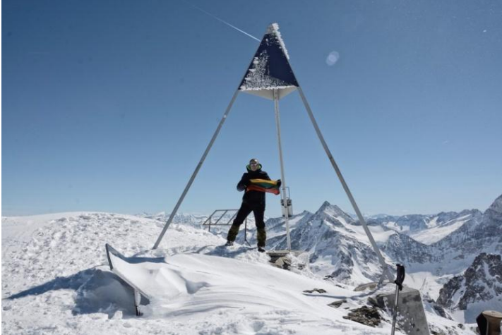
Titlis 3238 m. ( Šveicarijos Alpės)

Titlis 3238 m. ( Šveicarijos Alpės), Zugspitze 2962 m (Vokietijos Alpės).