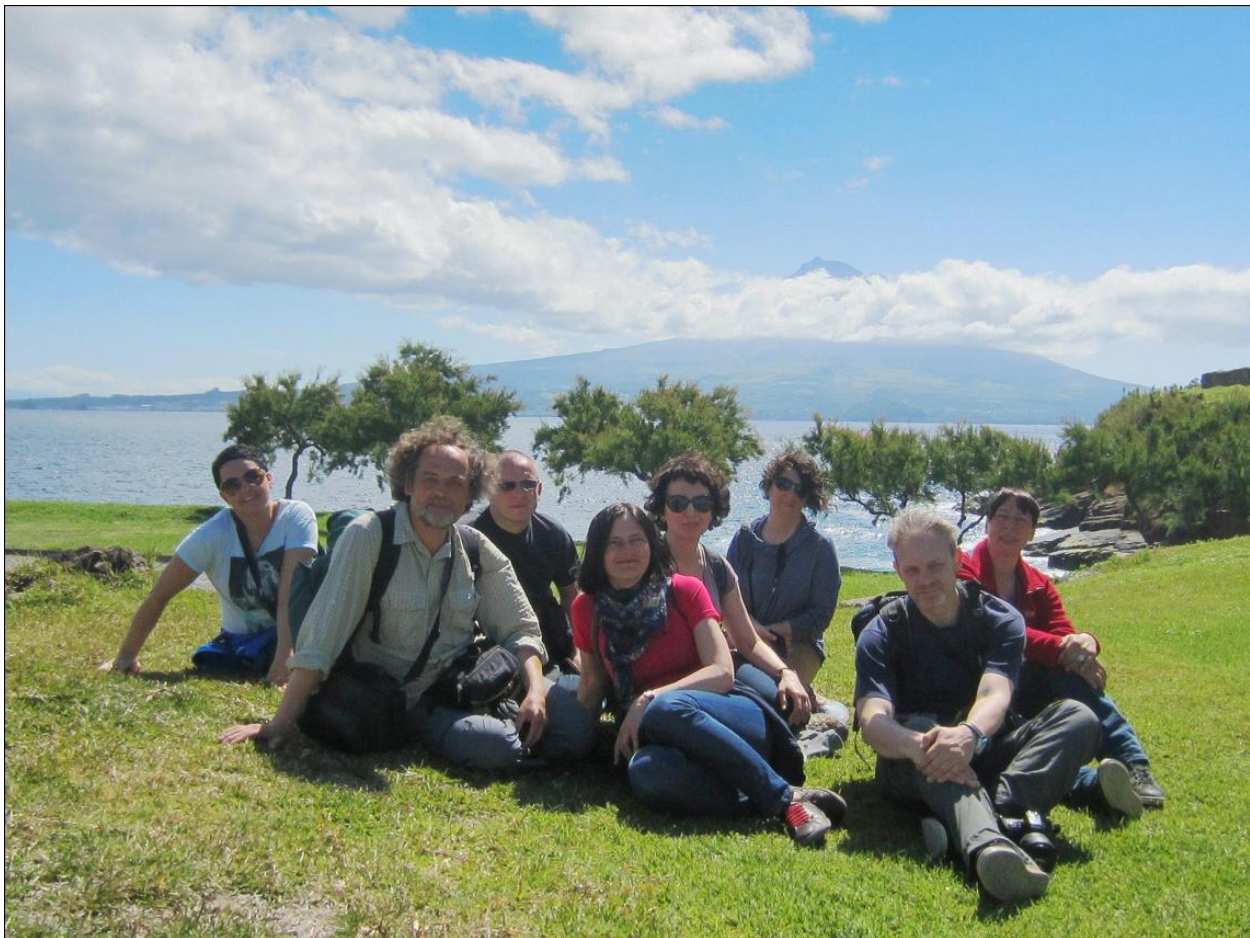
Azorų salose retai būna toks geras oras, kad galima būtų matyti visą ugnikalnį.