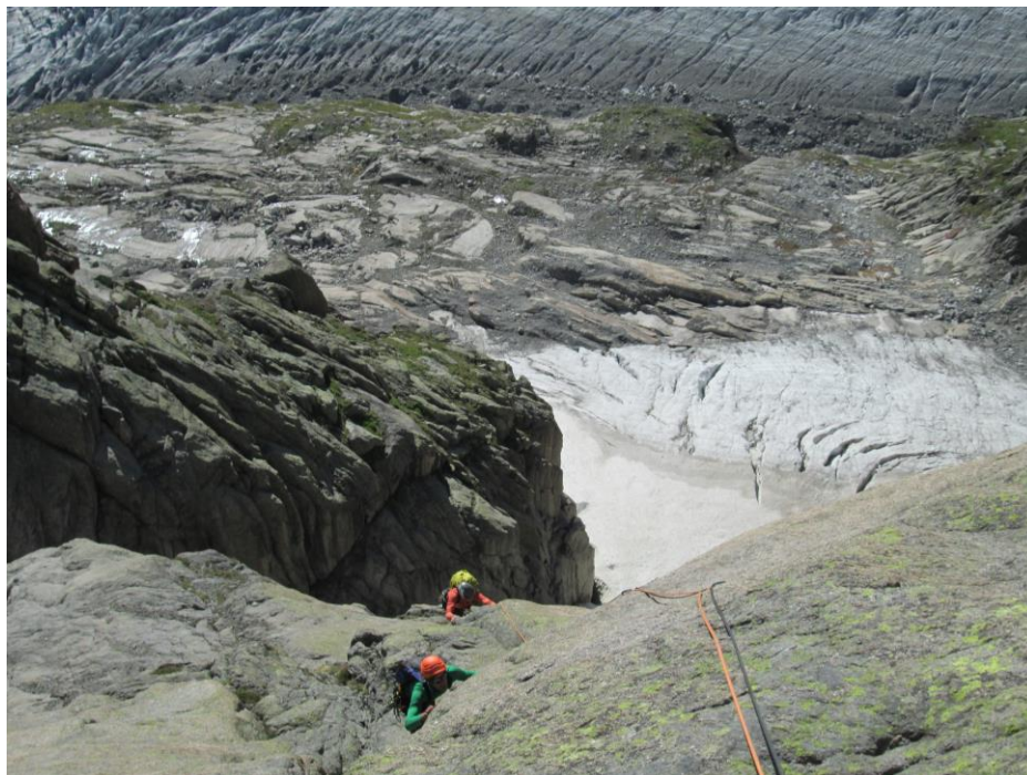
6 virvė