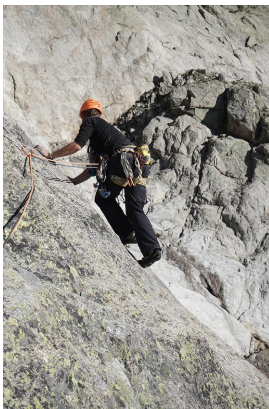
8 virvė