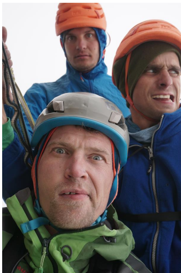
„Summit selfie“