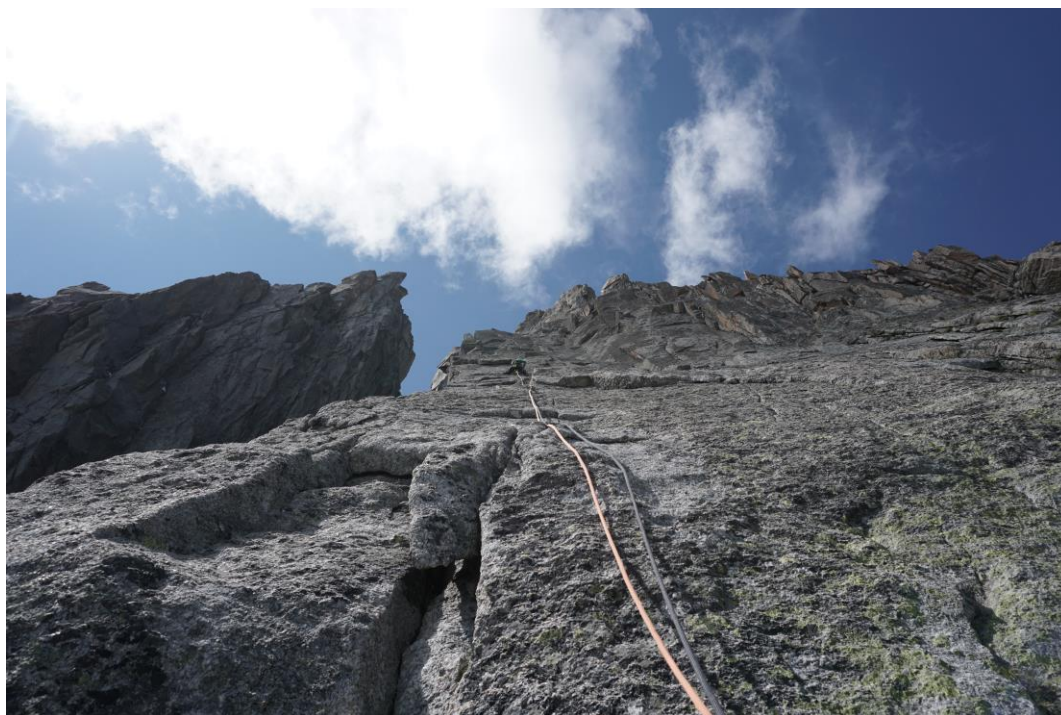
14 virvē