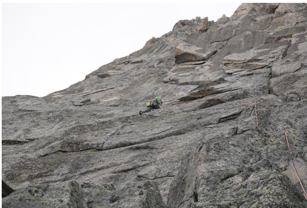
23 virvē