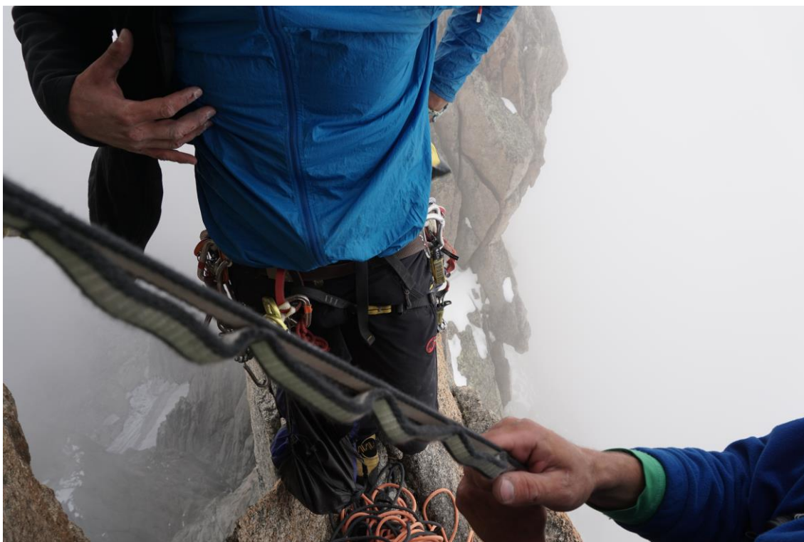
Ant viršūnės