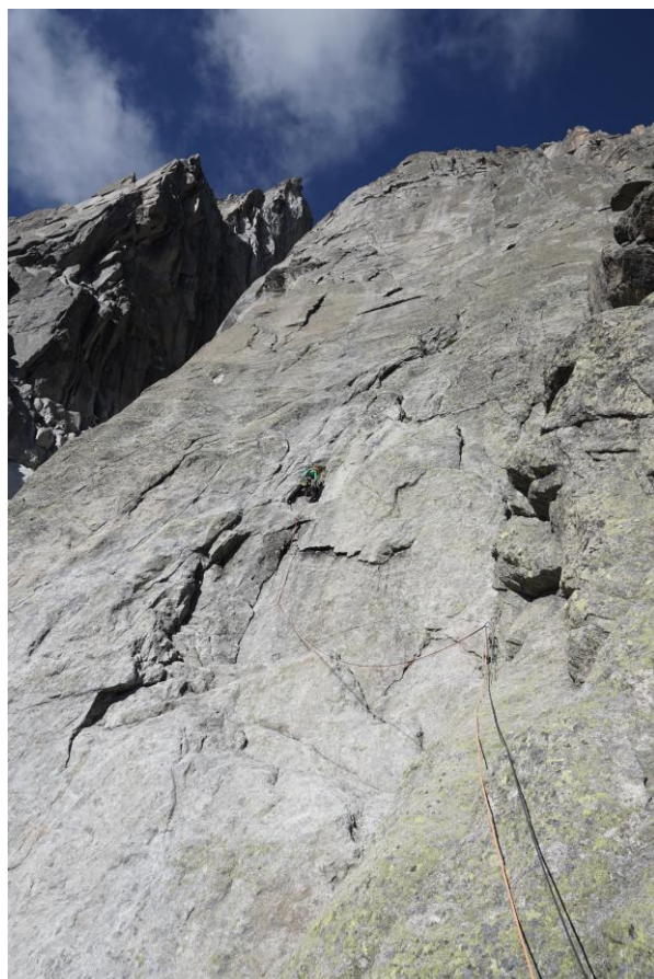
12 virvé