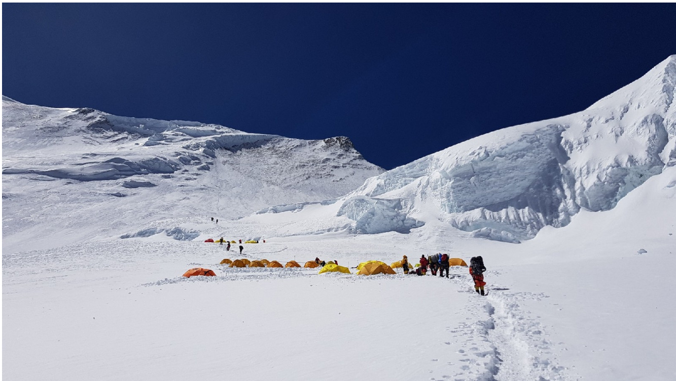
C3 leidžiantis iš C4