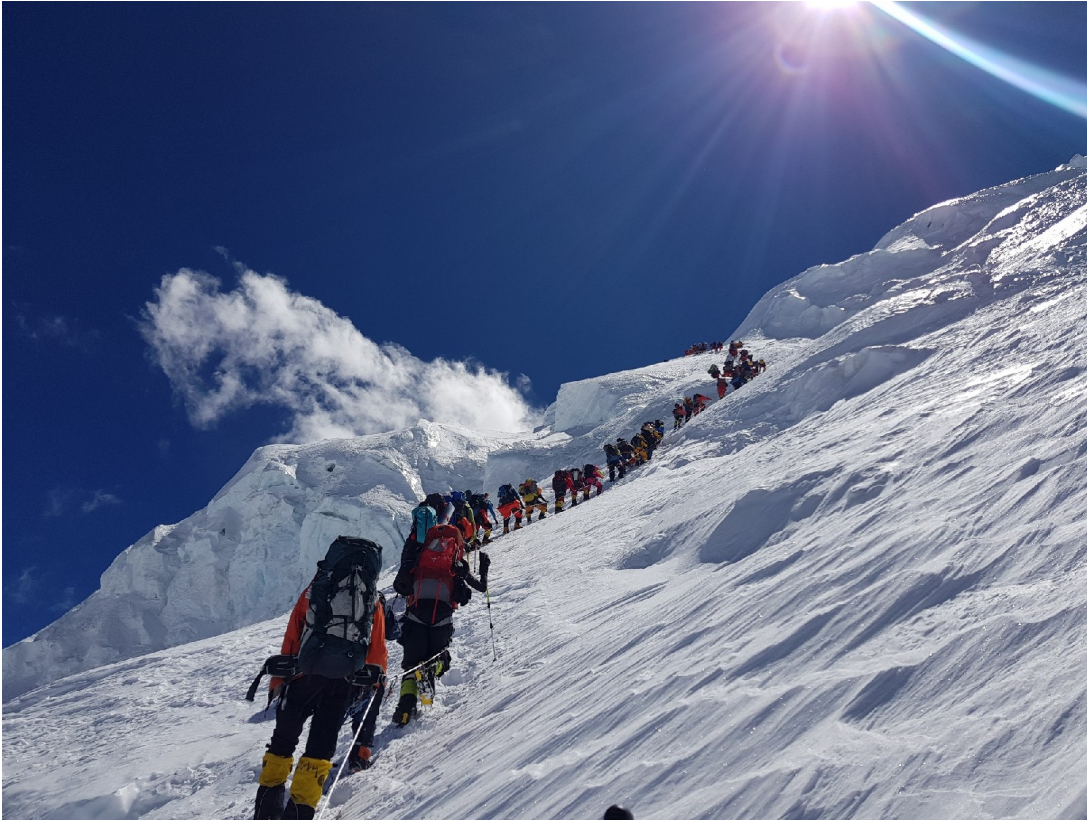
Kopimas iš C4 į viršūnę ir C4. 2018-09-28.