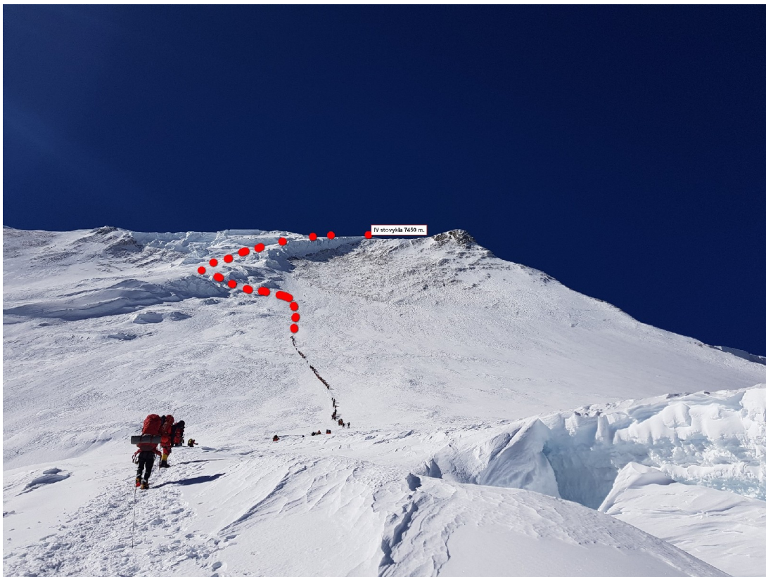
Eilės iš C3 6770 į C4 7450, aukštis apie 7100 m