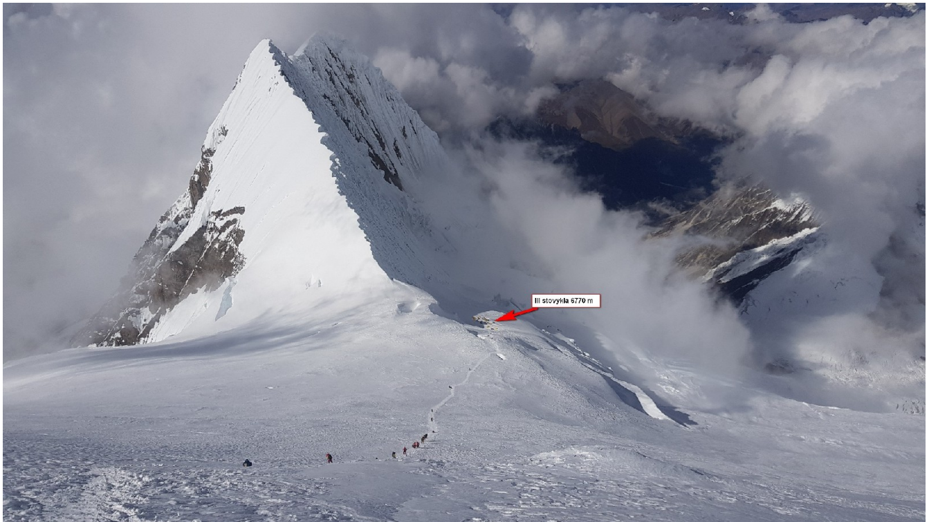
Maršrutas ir eilės iš C3 6770 į C4 7450