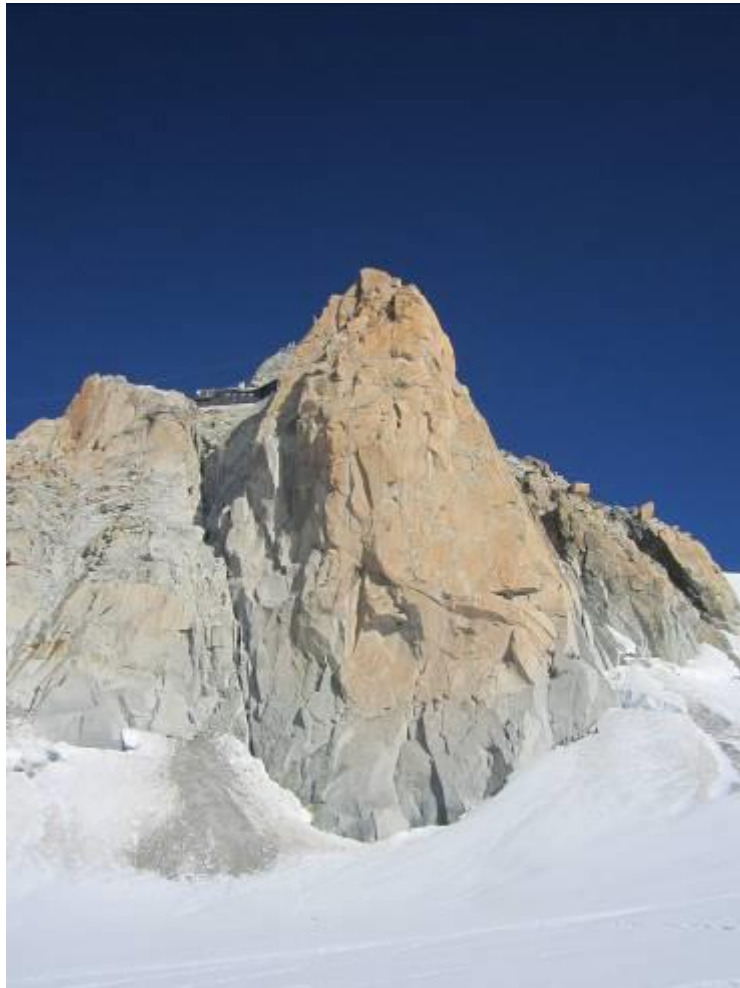
Aiguille du Midi viršūnė, 3,842m

Pietinė siena, Rebuffat maršrutas (Sunkumas: TD+, Uolinis: 6a, 5.10a.)