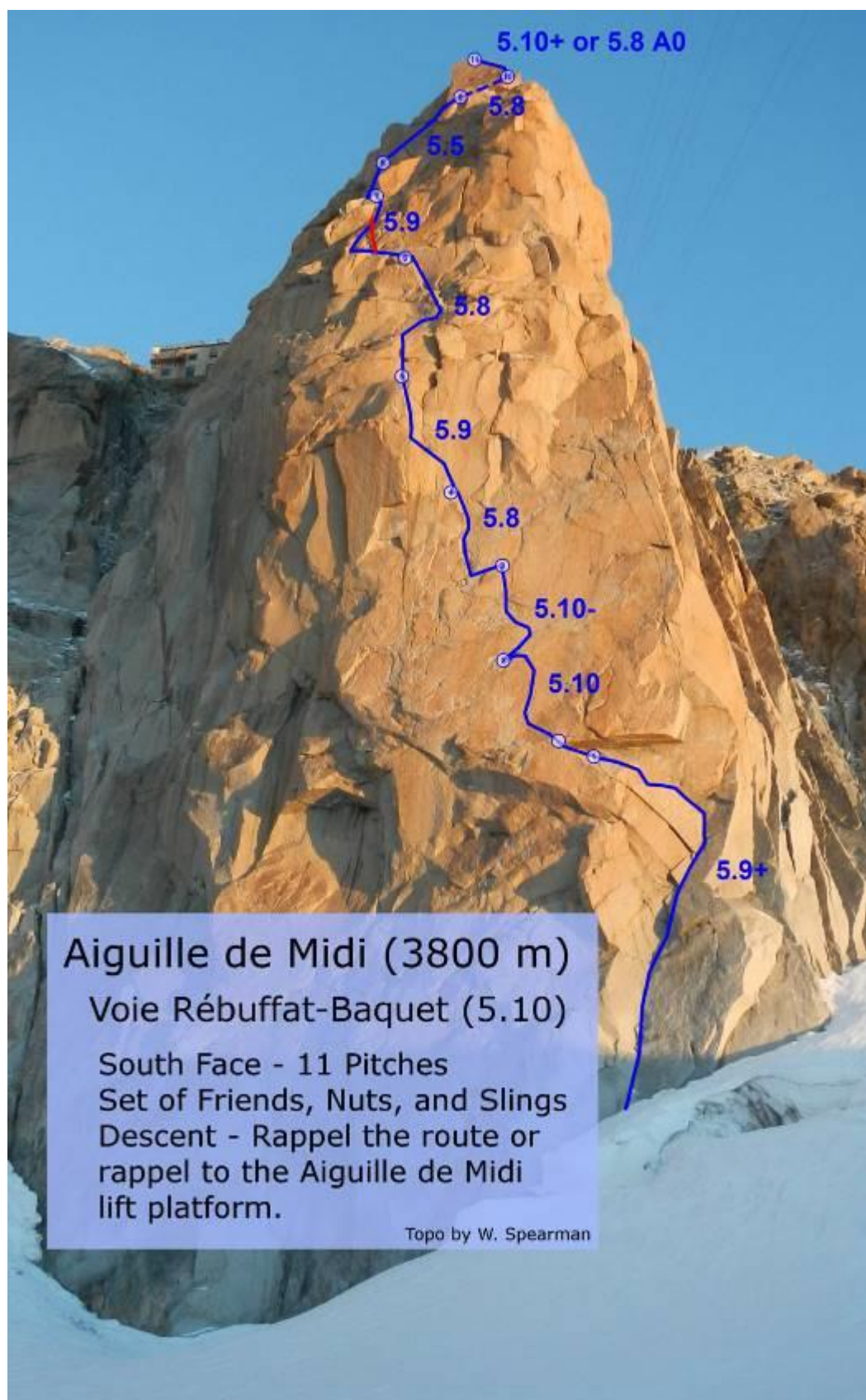
Schema Nr. 1