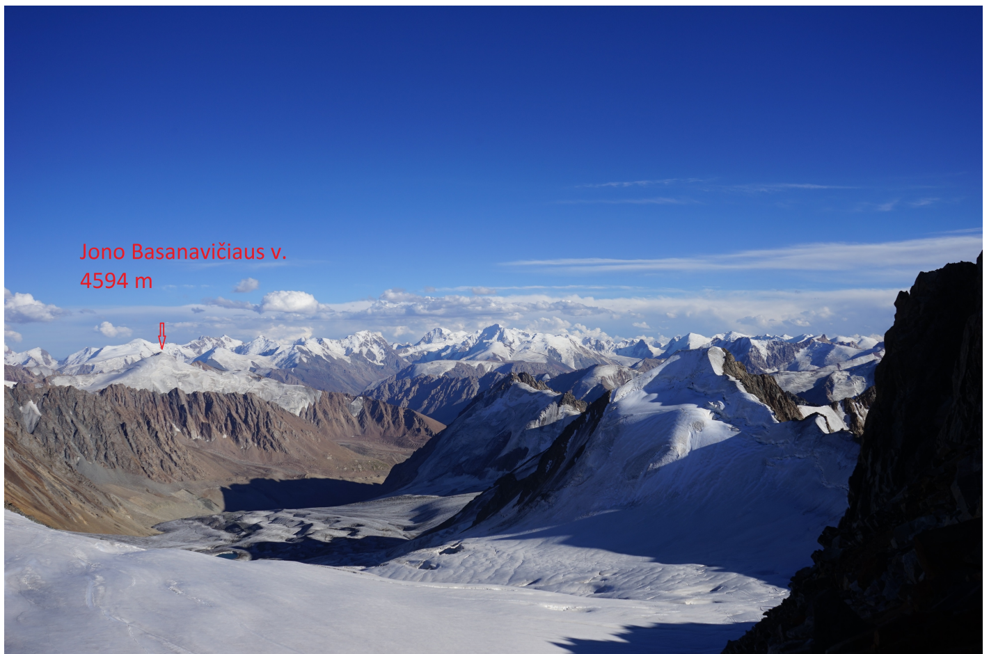
Vaizdas nuo 4721 m keteros