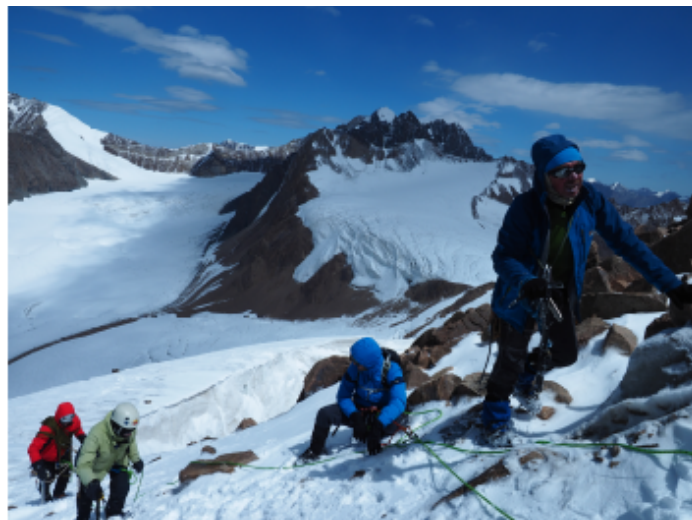
Kopimas į bevardę viršūnę (vėliau pavadintą Jono Basanavičiaus vardu)