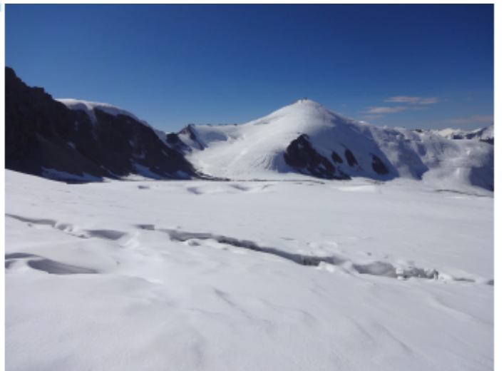
Žvilgsnis į viršūnę 2017.08.10 (kairėje) ir kopimo dieną 2017.08.13 (dešinėje)