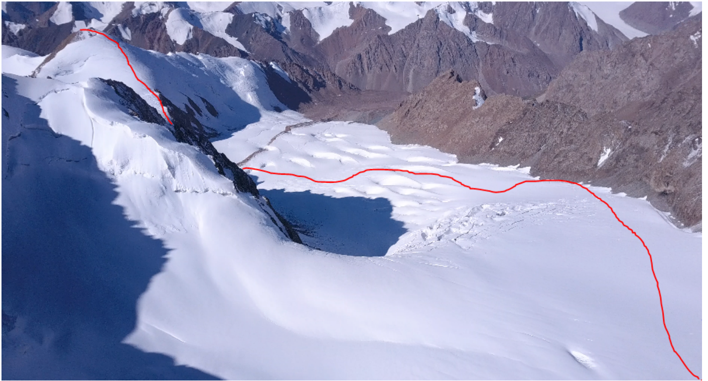
Maršrutas link J. Basanavičiaus viršūnės