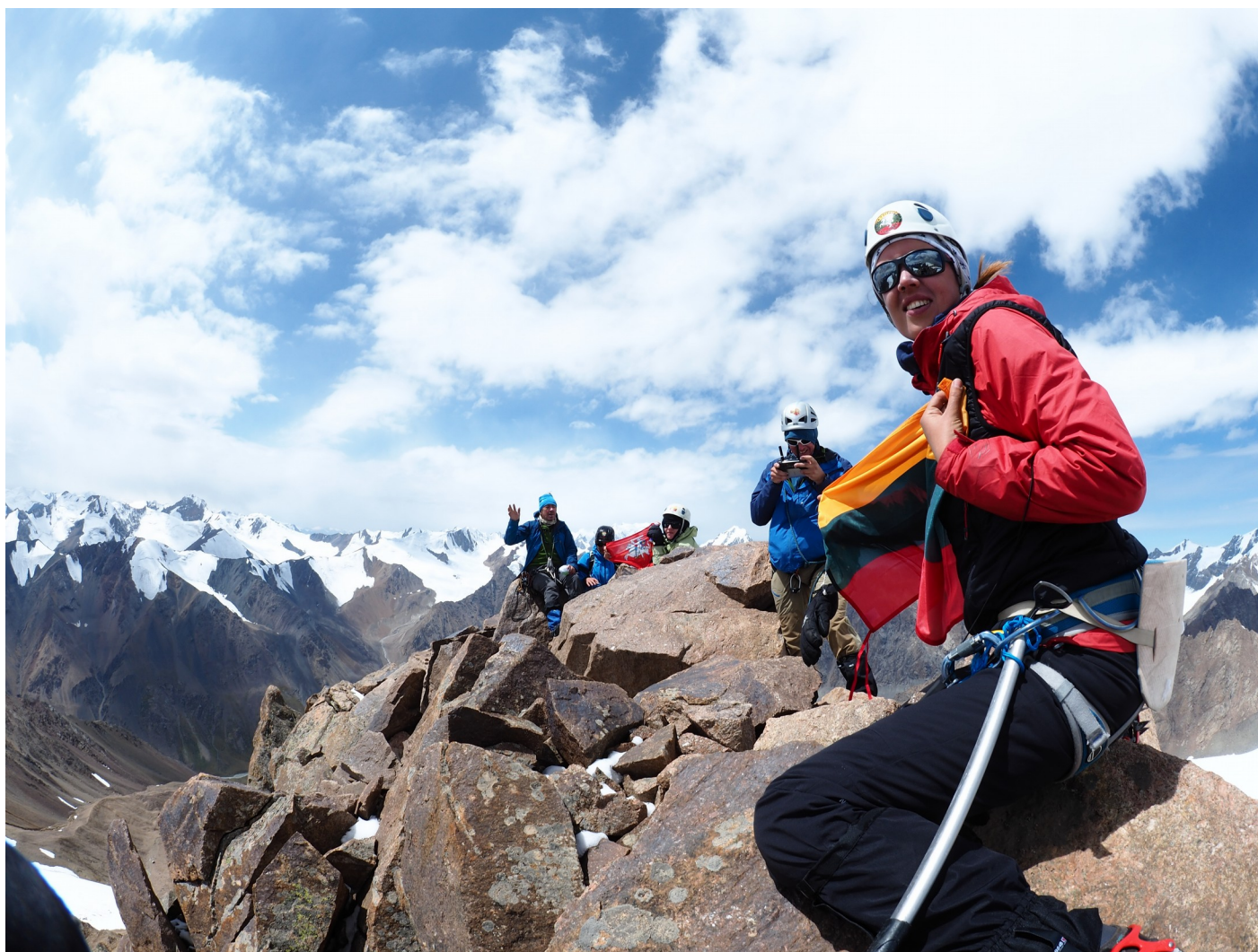
Jono Basanavičiaus viršūnė 4594 m