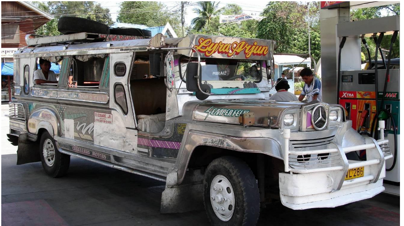
8. Kelionė į Apo iš pietvakarinės kalno pusės prasideda nuo Kidapawan mietelio, esančio 3 valandos kelio autobusu arba džipniu (jeepney) nuo Davao.