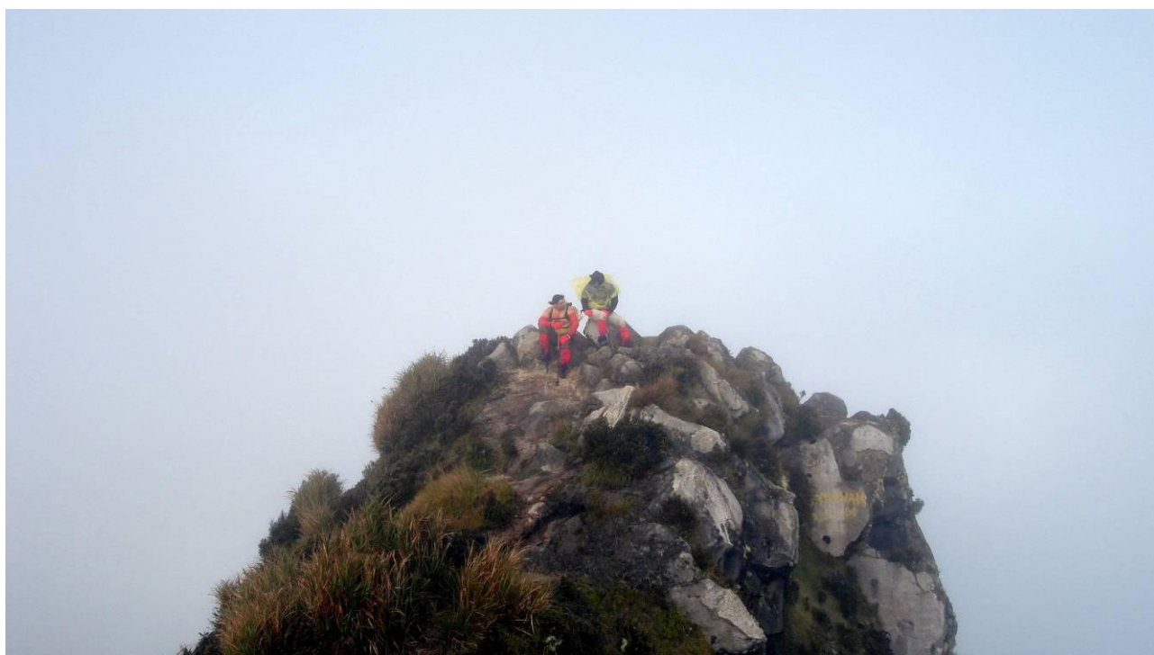
18. Apo viršūnē tai atskiras kalnas išaugęs iš kalderos