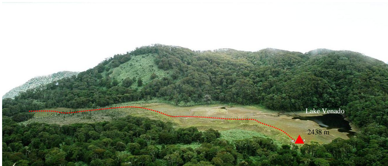
16. Kopimo kelias iki Lake Venado (Venado ežero)(2438 m) stovyklos ir po jos.