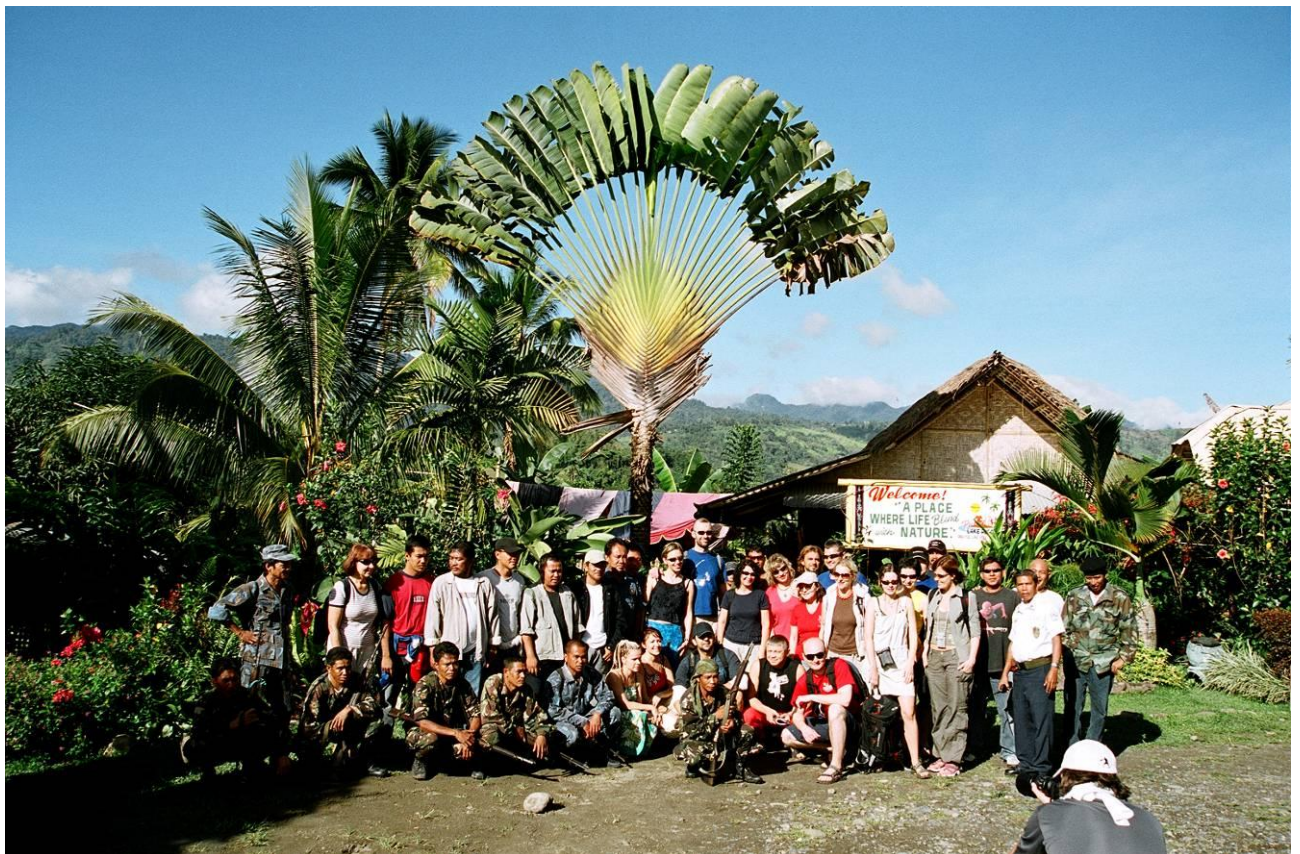
6. Mus vienokia ar kitokia forma saugodavo arba kariuomenė arba policija, arba privati apsauga.