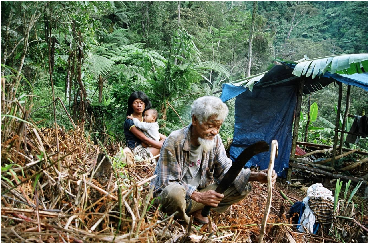
2. Apo yra šventa vieta Lumad genčiai