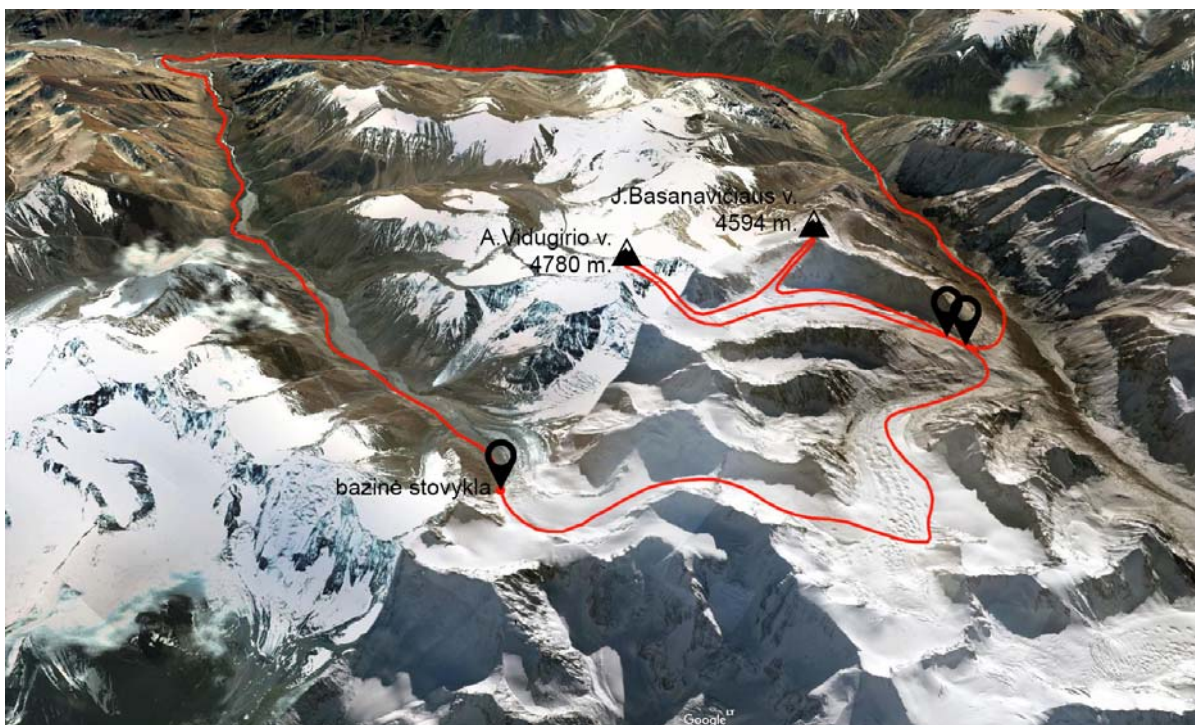
Antros grupės trijų dienų maršrutas