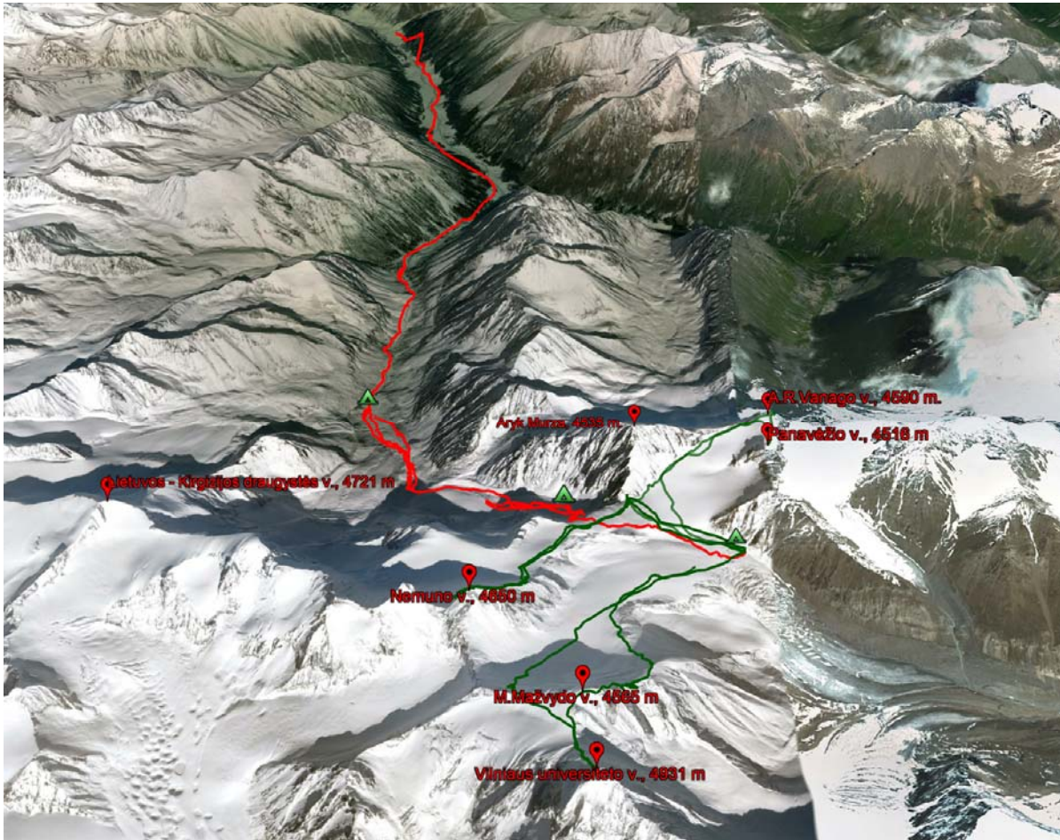
Pagrindinis maršruto žemėlapis