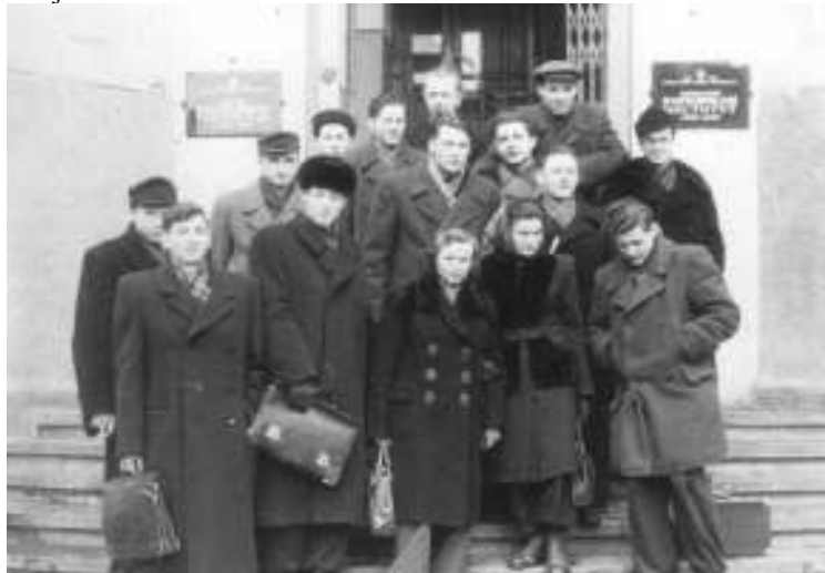
Prie II-ųjų rūmų

Gimiau 1933 m. rugpjūčio 28 d. Plungėje, ūkininko šeimoje. Tėvas, 1918-20 m. Lietuvos nepriklausomybės kovų dalyvis, netoli Plungės buvo gavęs žemę. 1953 m. baigiau Plungės vidurinę mokyklą. 1958 m. baigiau Kauno politechnikos institutą, buvo suteikta inžinieriaus elektriko kvalifikacija, elektrinių, elektros tinklų ir sistemų specializacija.