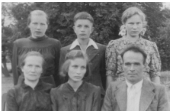
Su tėvais ir seserimis

Pirmieji poststudentiški metai. Dabar jie atrodo trumpi ir nereikšmingi, o tuomet tai atrodė epocha, lemianti gyvenimą. Neturint kito, tuomet dar rėmiausi į studentišką praeitį ir patirtį.