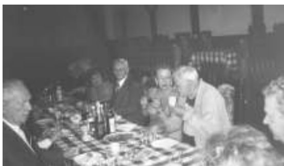
1998m. susiūkime Dubingiuose

Dabar gyvenu Kaune, V. Krėvės prospekte.