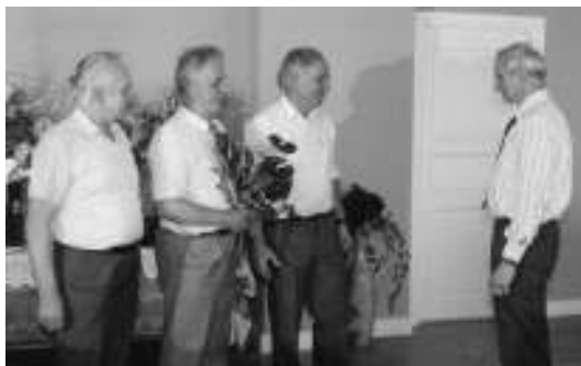
Su gëlėmis draugo jubiliejuje

1993 – 2001 metais dirbau Energetikos ministerijoje, Energetikos agentūroje ir Ūkio ministerijoje vyriausiojo inžinieriaus, vyriausiojo specialisto pareigose.