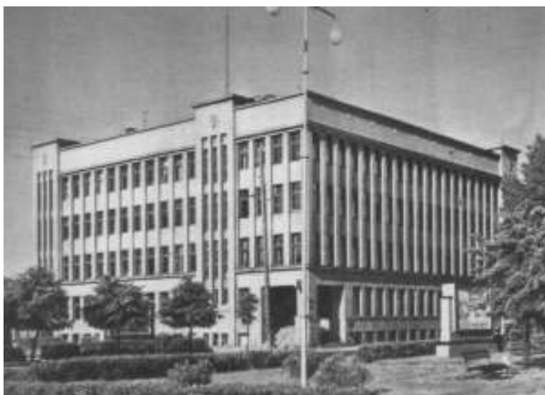
KPI Centriniai rūmai