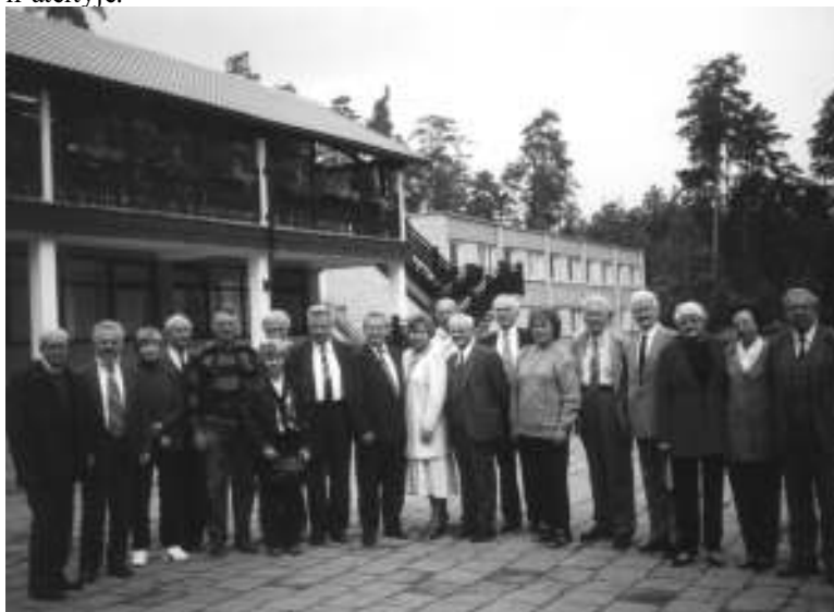
„Lietuvos energijos“ poilsiovietėje

Esu įsitikinęs, kad Lietuvos energetika pakankamai stipri, techniškai pažangi, energetikai savo darbo meistrai. Energetika niekada nebuvo kliūtis Lietuvos ūkio raidai. Labiausiai norėčiau, kad to nebūtų ir ateityje.