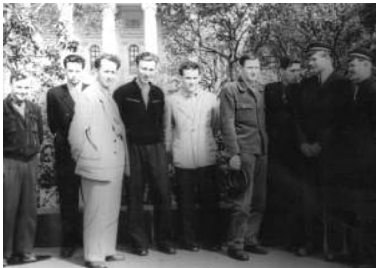
Tarp būsimųjų energetikų