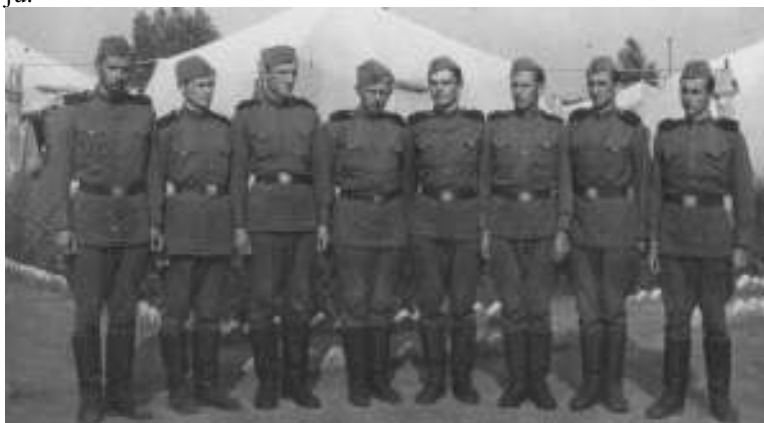
Senas kareivis tarp jaunikių

1953 – 1958 m. mokėsi KPI Elektrotechnikos fakultete. 1958 m. dirbo Antalieptės SMV inžinierium, nuo 1959 m. pervestas į Anykščių SMV gamybinio – techninio skyriaus viršininko pareigas. 1964 m. paskirtas valdybos vyriausiuoju inžinierium, o nuo 1971 m. iki 1987 m. dirbo tos pačios statybos – montavimo valdybos viršininko pavaduotoju.