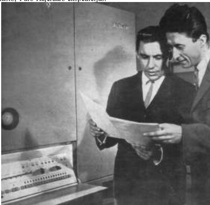
Prie Rūtos 701