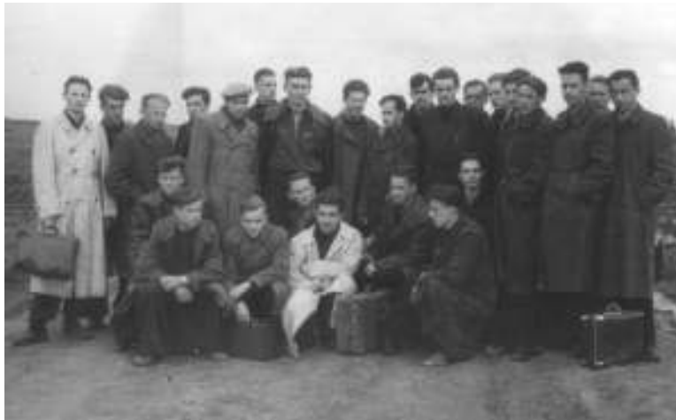
Į priverstinį darbą kolūkyje