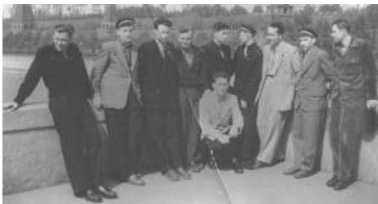
Su studentais užsienyje