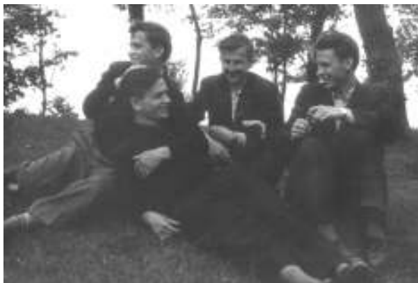
Studentiška praktika Jūrmaloje

Baigęs Girkalnio progimnaziją vienerius metus mokiausi Ra-seinių vidurinėje mokykloje, o dvejus paskutiniuosius metus Klaipėdoje Donelaičio vardo vidurinėje mokykloje (dabar Vytauto Didžiojo gimnazija). Nuo mokymosi Klaipėdoje iki instituto baigimo visur ir visada mane lydėjo skurdas. Nežiūrint į tai, 1953 metais buvo nepaprastai didelis džiaugsmas įstojus į Kauno Politechnikos institutą elektrotechnikos fakultetą, kuriame net į dvi grupes susirinko bendraminčiai iš visos Lietuvos. Nežiūrint įvairiausių sunkumų studijų metai buvo malonūs, nes juos lydėjo jaunatviškas išradingumas ir optimizmas. Apie studijų metus nereikia ir rašyti, nes į kiekvieno iš mūsų atmintį apie juos daug kas įsirašė taip stipriai, kad nepamiršime kol gyvi būsime.