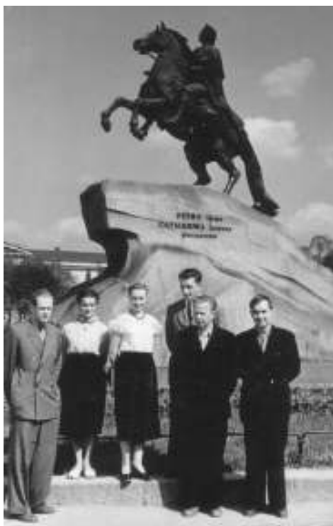
Baltųjų naktų šventėje

vau priimtas tik kandidatu, studentu tapau žymiai vėliau, iškritus nepažangiems studentams), tai neleido man su choru „Varpas“ išvykti į koncertines keliones į kapitalistines šalis, užimti aukštesnes kaip laboratorijos viršininko pareigas ir t. t.