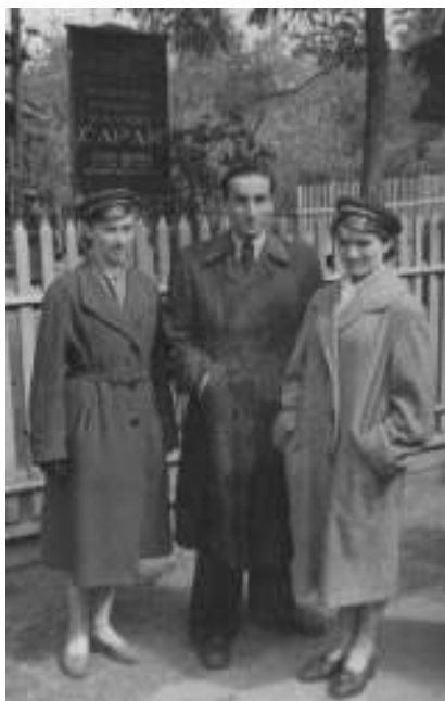
Pagerbtas tarp studentų

Ankščiau nepaminėjau dar vieno mano potraukio - sporto. Vidurinėje mokykloje buvau šioks toks sportininkas, žaidžiau mokyklos krepšinio rinktinėje, jėgas išbandžiau lengvojoje atletikoje, stalo tenise, netgi šachmatuose ir šaškėse.