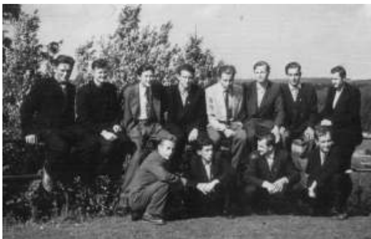
Su grupės draugais