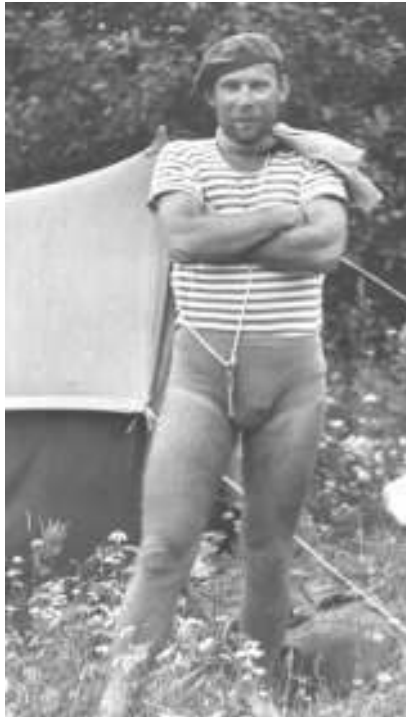
Atokvėpis gamtoje 1970m.